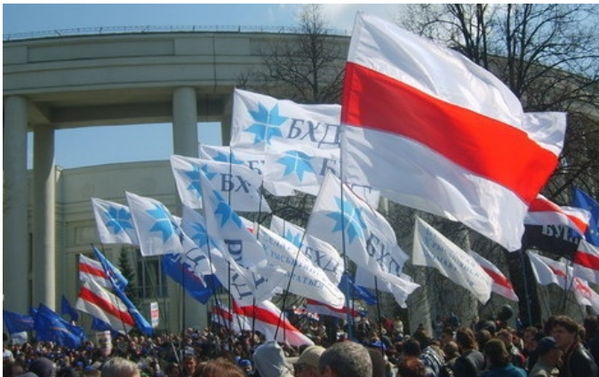
Хрысьціянскія дэмакраты на шэсьці

Арыенцірам у нашай дзейнасьці зьяўляецца праца такіх беларускіх дзеячоў-хрысьціянаў, як Еўфрасіньня Полацкая, Кірыла Тураўскі, Канстанцін Астрожскі, Францішак Скарына, Мікалай Радзівіл Чорны, Астафій Валовіч, Язэп Ручкі, беларускія хрысьціянскія дэмакраты пачатку ХХ стагодзьдзя.